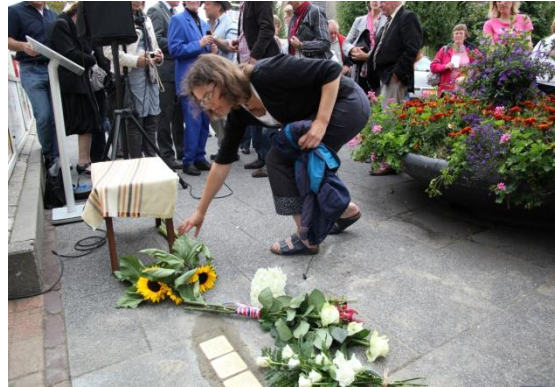
Door de werkgroep Oostvoorne en belangstellenden werden bloemen gelegd.