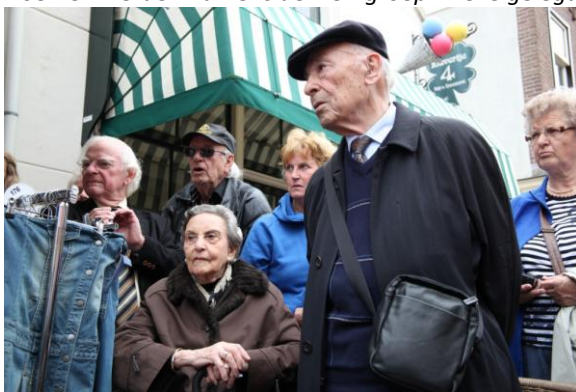
Er was veel belangstelling