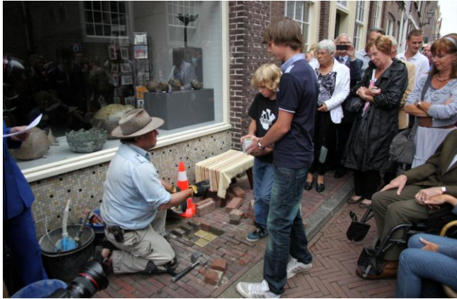
Achter-achterkleinzonen geven steentjes.