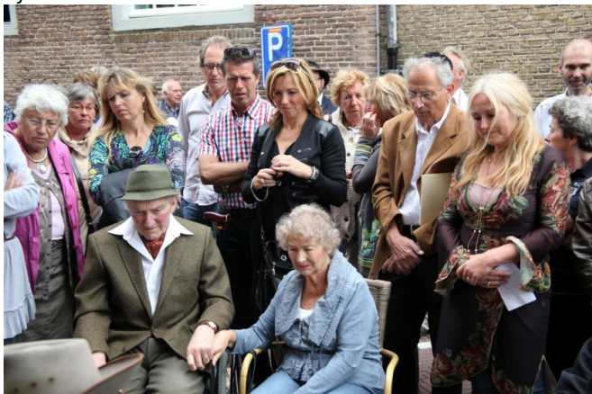
En veel familie en belangstellenden.