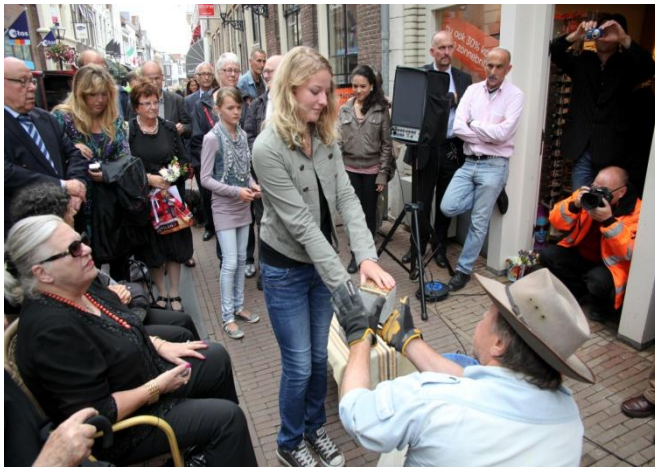
Familie en scholieren reiken steentjes aan